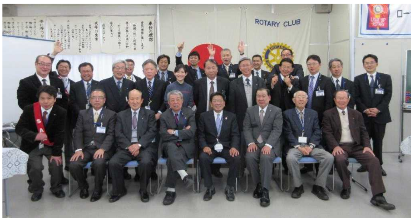
(株)オオガノ 2Fで行われた 最後の例会