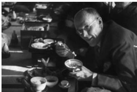
1936年、東京ですき焼きを楽しむポールハリス

また5月13日にはポールハリスの月桂樹3世の苗木が太田・新津ロータリークラブへ贈呈され平成14年には桐生西、赤城ロータリークラブへポールハリスの月桂樹4世が桐生運動公園と桐生プリオパレスの庭に植樹されました。昨日桐生運動公園へ行き写真を撮ってきました。ポールハリス氏は26ヶ国に『友愛に木』とし植樹をしていました。