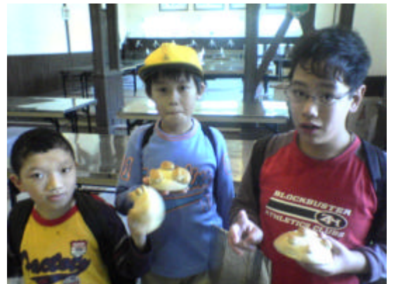
葛生証の子供たちとできたてのパン