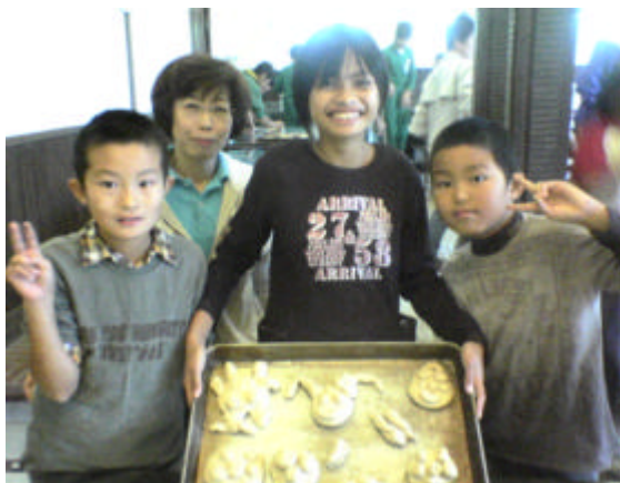
南賞の子供たちのパン作り