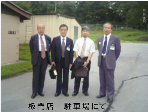
板門店 軍事停戦会議場